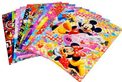
キャラクターファイル パールボールペン