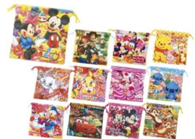
キャラクター巾着袋 プリマタオールハンカチ